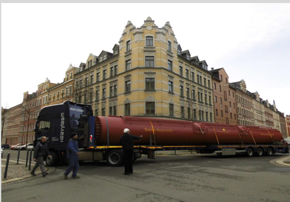
Anlieferung des Wärmetanks