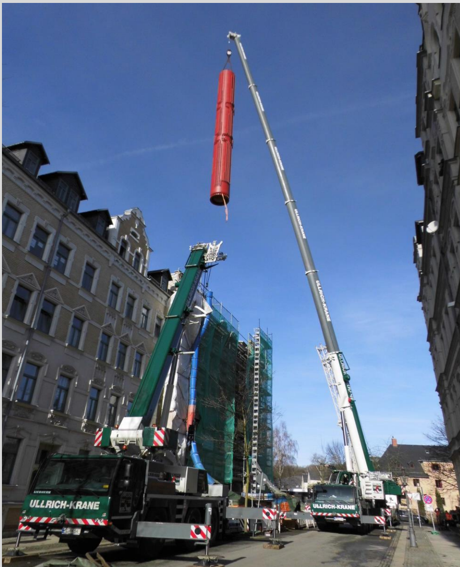
Speichersetzung Dorotheenstr. 17, 09113 Chemnitz

Die solare Deckung für 1.500 m 2 Wohnfläche wird 30 bis 40 % betragen. Das heißt, ein beträchtlicher Teil des Energiebedarfs an Heizung und Warmwasser wird kostengünstig und umweltfreundlich über Sonnenwärme ganzjährig erwirtschaftet. Damit sinken die Nebenkosten deutlich und langfristig. In dem Objekt entstehen 13 Mietwohnungen mit 2 bis 6 Zimmern und einer Wohnfläche zwischen ca. 70 und 155 m 2 . Selbstverständlich verfügen alle Wohnungen über Balkone und einen Aufzug.